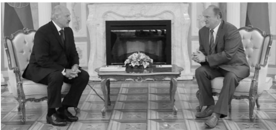
Пресс-служба ЦК КПРФ

19 июля 2016 года телеканал «Россия 1» в программе «Вести» показал сюжет о посещении Председателем ЦК КПРФ Г.А. Зюгановым Республики Беларусь.